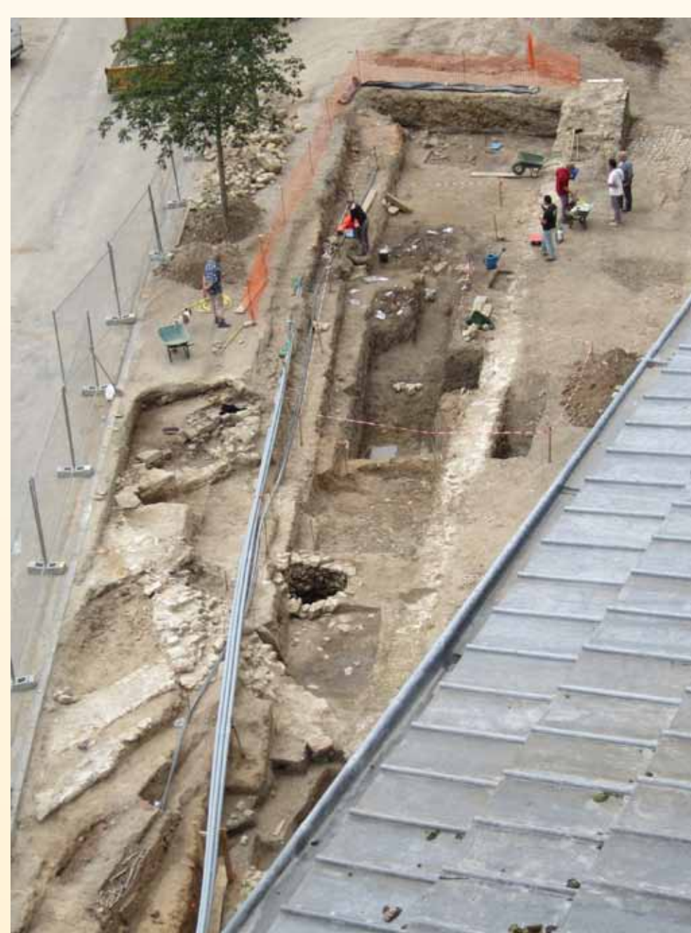
Vue de la fouille depuis la tour nord de l'église prieurale.