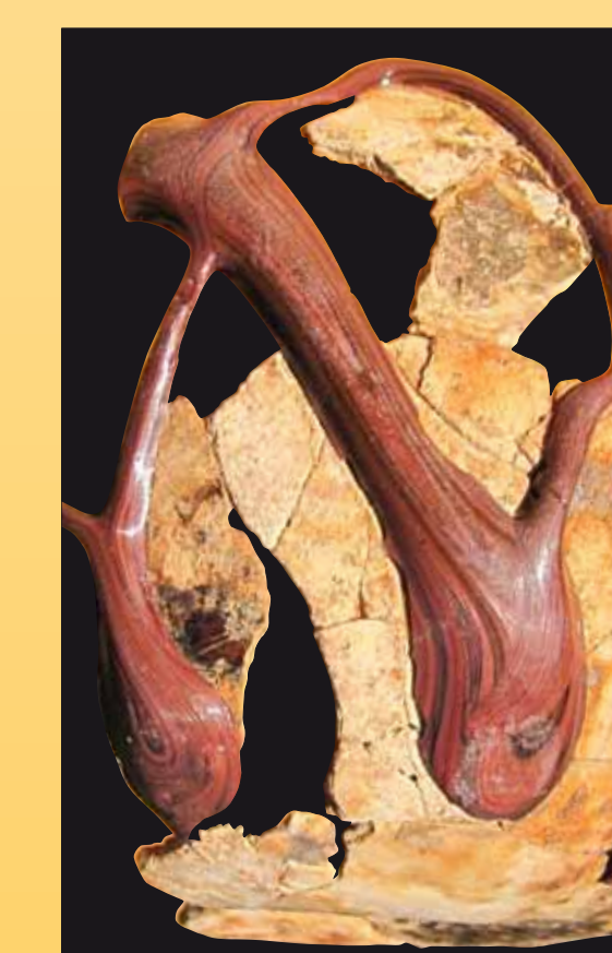
Détail du décor de filets.