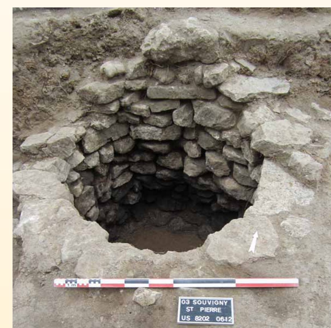
Vue du puits en fin de fouille.

En l'attente des résultats des analyses par le radiocarbone, il est possible d'attribuer cette structure à une période allant du XI e au XIII e siècle. Sa partie supérieure a été écrêtée, bien après son comblement, lors de travaux de terrassement au XIX e siècle.