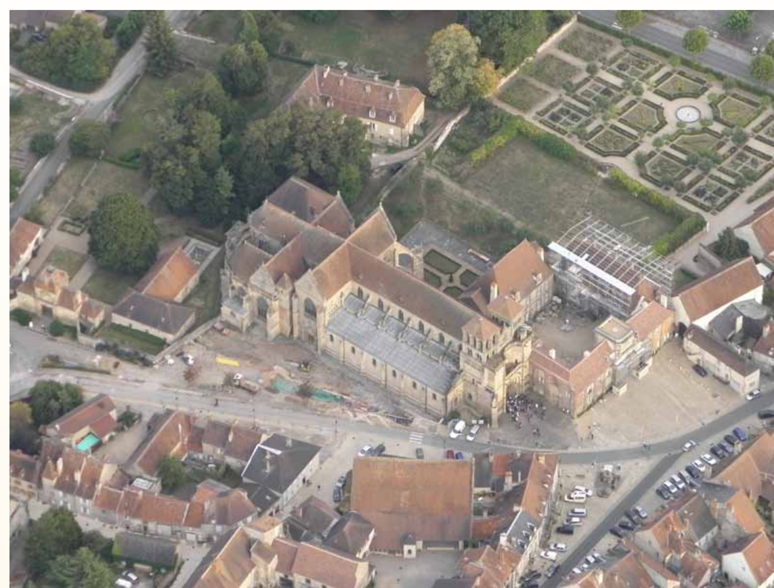
Vue aérienne du site depuis le nord-ouest.