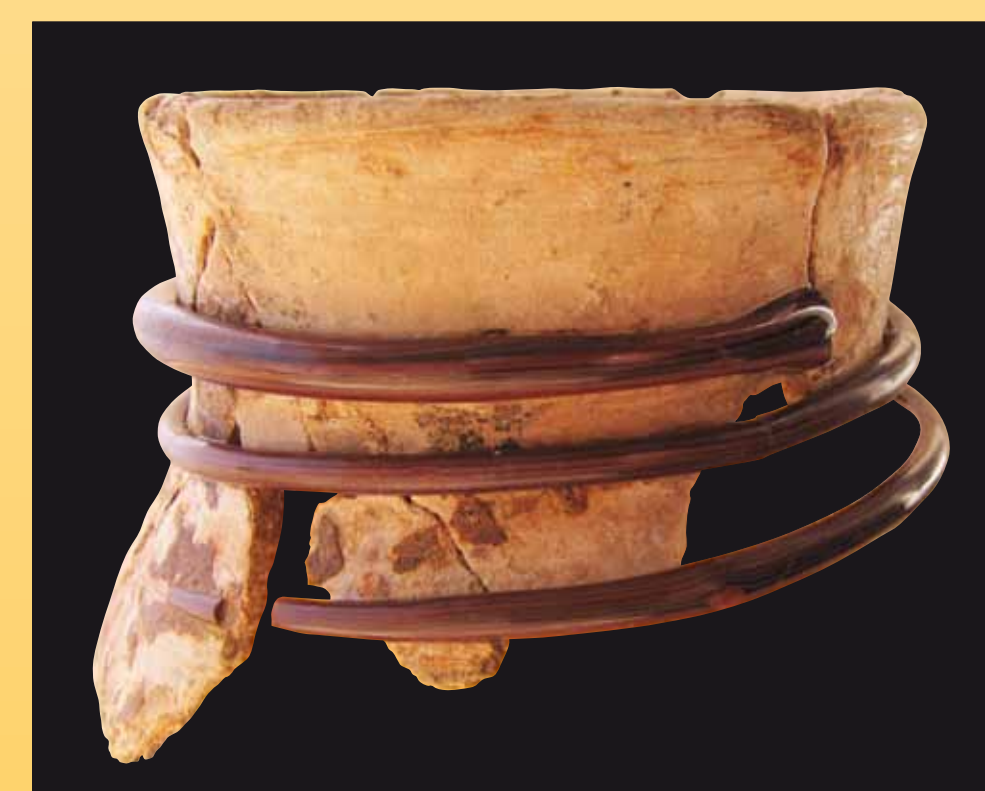
Col du pot/gobelet (cliché S. Liegard).