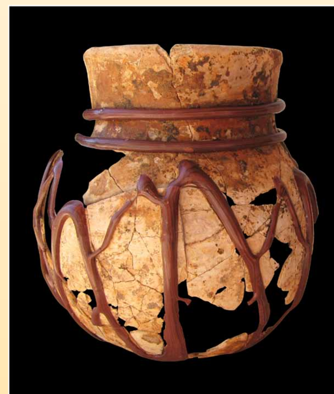
Reconstitution du pot/gobelet.

En premier lieu, ils ont fait l'objet d'une consolidation par immersion dans l'acétone avec 10 % de résine méthacrylate Paraloïd B72®. En second lieu, un nettoyage au pinceau imbibé d'éthanol a été effectué, avant le remontage réalisé avec la même résine diluée à 25 % dans de l'acétone. Un doublage au papier japon a permis de consolider les jonctions les plus fragiles.