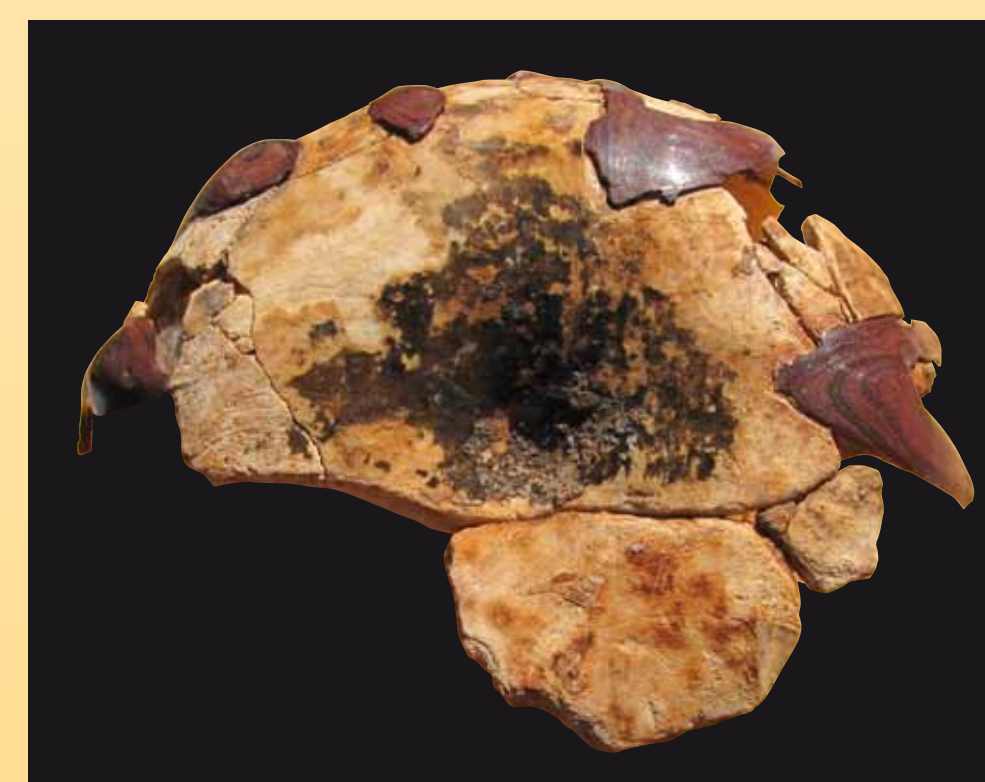
Fond du pot/gobelet (cliché S. Liegard).