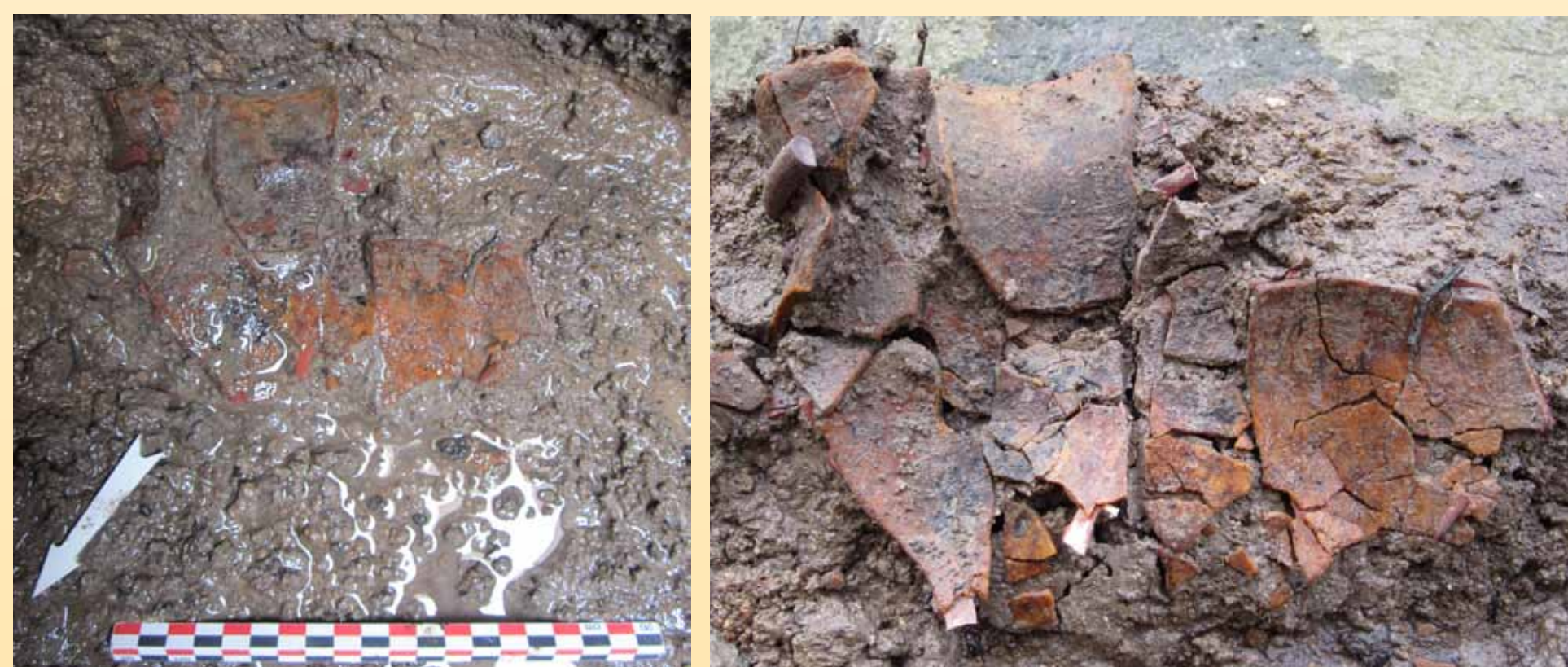
Vue des tessons du pot/gobelet lors de la découverte dans le puits et après prélèvement.

La fouille a permis de recueillir de nombreux tessons provenant d'une verrerie de type pot/gobelet. Le tamisage de l'ensemble des sédiments a livré les fonds de trois autres récipients tronconiques et deux fragments de décors à base de filet.